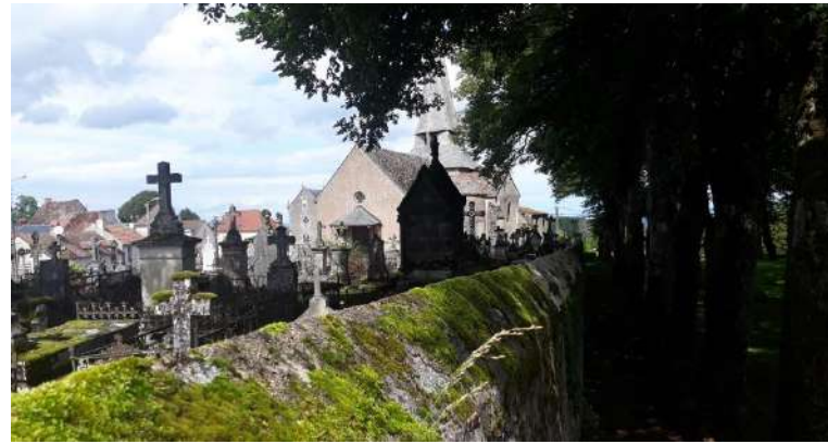
Kerkhof Souillac

Met een bedevaart naar Rome of Jeruzalem schoot je al een heel eind op, de minder sportieven kochten gewoon een aflat. Dat zorgde voor een lucratief handeltje, dat begin 16de eeuw ongekende proporties aannam. De dominicaan Johan Tetzel blonk daarin uit, tot afgrijzen van Martin Luther. Met een deel van de opbrengst van die aflaten werd de nieuwe Sint-Pieters in Rome gefinancierd.