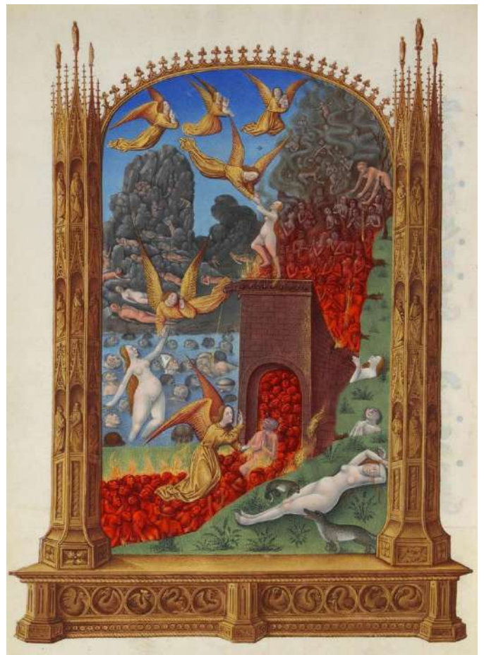
Vagevuur uit Les très riches heures du duc de Berry

De duur van het verblijf in het purgatorio ( La Divina Commedia van Dante ) varieert. Wie veel zonden op haar of zijn kerfstok heeft, mag wat langer sudderen dan hij of zij die nauwelijks wat mispeuterde. Door te bidden voor het zielenheil van de overledenen, kunnen we dat verblijf wat inkorten en dat is er wat gebeurt of zou moeten gebeuren op Allerzielen.