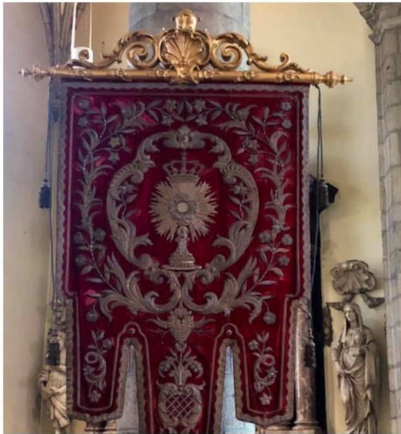
MEER DAN DRIE EEUWEN GELOOF, TRADITIE EN DEVOTIE VOOR DE HEER DIE ONS NABIJ BLIJFT ONDER DE EUCHARISTISCHE GEDAANTEN VAN BROOD EN WIJN

De Confrérie van het Allerheiligste Sacrament is de oudste nog bestaande vereniging van Sint Niklaas en telt een 70-tal leden.