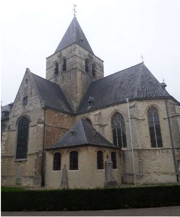
Foto 1 Een buitenaanzicht van de kerk met koor, sacristie, transept en toren

Het Vlaams-Brabantse Opwijk mag bogen op één van de oudste Paulus-tradities in Vlaanderen. Onze heilige neemt er al ruim 600 jaar een vooraanstaande plaats in. Uit een oorkonde van de bisschop van Kamerrijk uit 1108 blijkt dat de kerk 'toegewijd was' (1) aan de Heilige Drievuldigheid. Uit een ander document van 1428 leren we dat de vermoedelijke bouwer van de nieuwe kerk vermeld staat als pastoor van 'Sint-Paulus in Opwijk' (1). Sommigen menen dat de parochie al sinds 1300 aan Paulus was gewijd. Vanaf de 15 de eeuw wordt Pauwel hier steeds vaker als doopnaam gekozen, terwijl in de 14 de eeuw niemand in de gemeente die naam droeg. Paulus staat bovendien afgebeeld op alle gemeentelijke zegels sinds de 16 de eeuw.