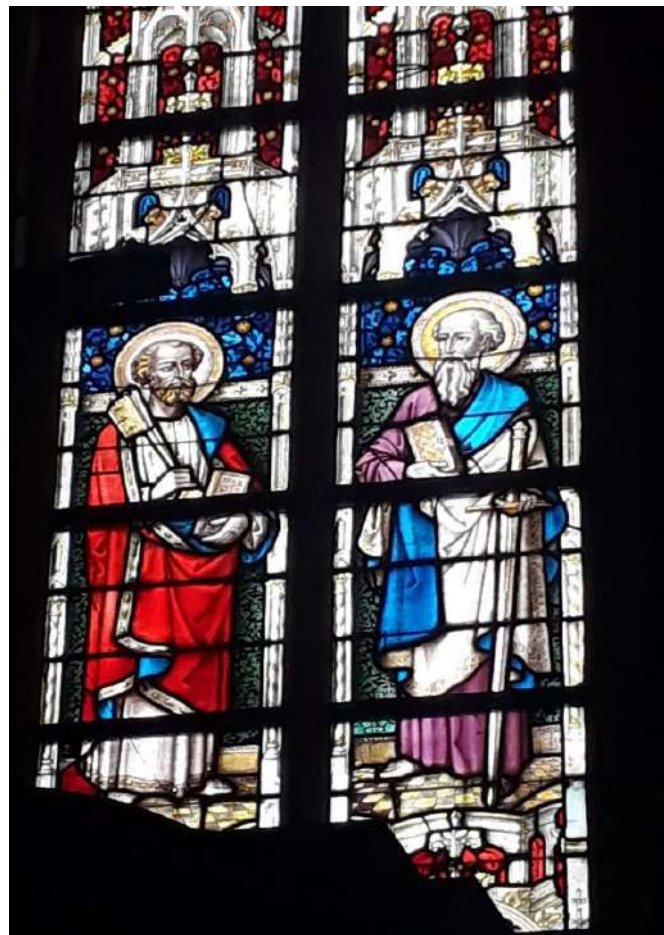
Foto 3 Petrus en Paulus, glasraam van G. Ladon in het koor (1894)

De geschiedenis van het kerkgebouw gaat zoals eerder gezegd terug tot het begin van de 15 de eeuw, uiteraard in de gotische stijl. In 1579 werd de kerk grotendeels verwoest door de zogenaamde 'Malcontenten'. Een 20-tal jaren voor de inval van de Fransen werd het gebouw vergroot, het schip en de westgevel hebben daardoor een classicistisch uitzicht. Als beschermd monument (1957) onderging het gebouw een drietal restauraties: een uitgebreide in 1979-82, een restauratie van het orgel begin jaren '90 en nog niet zo lang geleden (2007-2008) werden nog allerlei kleinere herstel- en instandhoudingswerken uitgevoerd zoals de plaatsing van voorzetramen aan de buitenzijde van het koor.