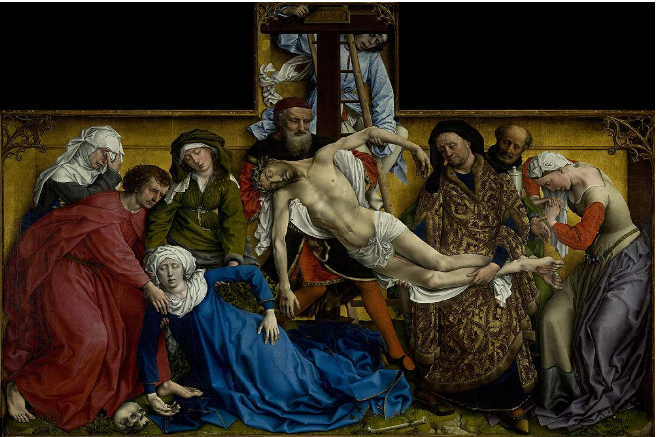
Rogier van de Weyden, Madrid (Prado), 1432-1435

Of Jezus als een halfgod en zelfverklaard Messias bewust de dood is tegemoet getreden en zichzelf als een lam heeft geofferd om de mensen te redden (Lc 18,32) of er daarentegen menselijkerwijze alles aan gedaan heeft om de Kruisiging te ontlopen (Mc 14,36), weten we niet. Feit is dat de daaraan gekoppelde, ijzersterke symboliek van zelfverloochening en naastenliefde in het passieverhaal pal overeenind blijft.