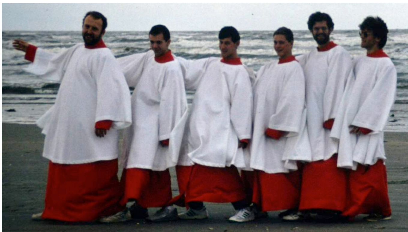
Gregorianisatie van de Deense kusten, 1992 – definitieve einde van de Noormannen