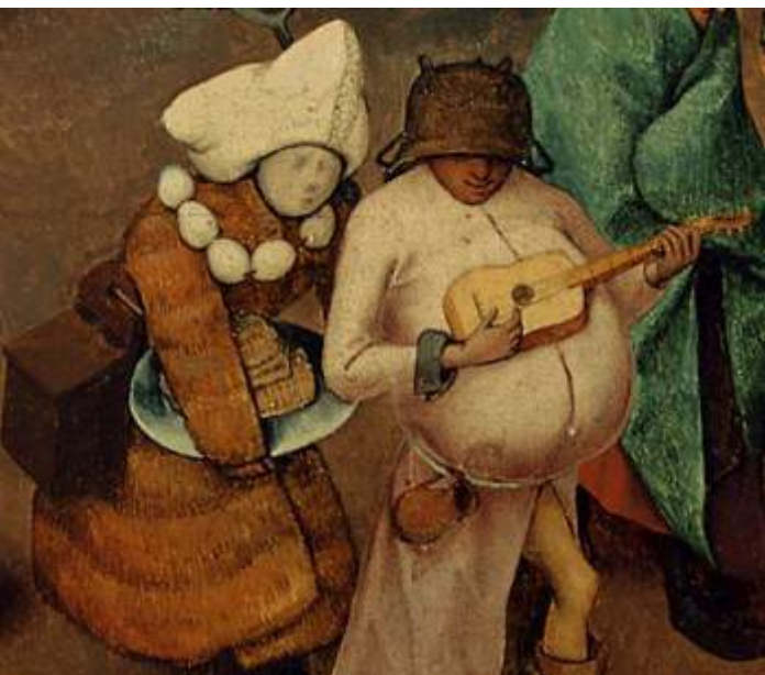
BRUEGHEL, Strijd tussen Vasten en Carnaval