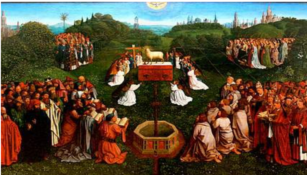
Jan van Eyck, Lam Gods, Gent (Sint-Baafskathedraal) 1430-1432,